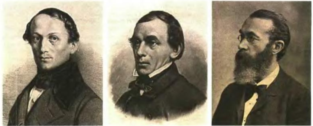
Από αριστερά: Έντουαρντ Τσελλερ (1814-1908), Χέρμαν Λότες (1817-1881), Βίλχελμ Βουντ (1832-1920).