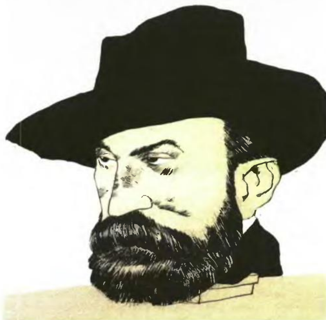
Ο Γεώργιος Βιζυηνός σε σχέδιο του Κωνσταντίνου Παπαμαχαλόπουλου.

Ο Γεώργιος Βιζυηνός (1850-1896) είναι γνωστός στο ευρύτερο κοινό από τα υπέροχης αφηγηματικής μαεστρίας διηγήματά του, που εξακολουθούν να μας συναρπάζουν και να μας συγκινούν παρ' όλη την απόσταση που μας χωρίζει από το ιδιότυπο γλωσσικό τους ιδίωμα - ή ίσως και εξαιτίας του. Τα πολυάριθμα ποιήματά του διαβάζονται σήμερα πολύ λιγότερο, και το η γλώσσα τους μας είναι περισσότερο οικεία, καθώς σπανίως κατορθώνουν να υπερβούν τις κάπως αφελείς αγκυλώσεις του φορμαλισμού που τα διέπει. Σχεδόν άγνωστα παραμένουν τα θεωρητικά του κείμενα, τα οποία κινούνται κυρίως στον χώρο του φιλοσοφικού προβληματισμού, με έμφαση στη φιλοσοφική ψυχολογία και την αισθητική θεωρία, πραγματεύονται όμως επίσης ζητήματα που σχετίζονται με τη λογοτεχνική ιστορία και κριτική, τη λαογραφία, καθώς και μερικά άλλα συναφή θέματα. Η επανέκδοση των τελευταίων αυτών δοκιμακίου χαρακτήρα έργων του σε έναν συγκεντρωτικό τόμο συνιστά πολύτιμη συμβολή όχι μόνο στη μελέτη της συνολικής προσφοράς του συγκεκριμένου συγγραφέα, αλλά και στην εξιχνίαση του ευρύτερου πνευματικού περιβάλλοντος μέσα στο οποίο αυτός έζησε και δημιούργησε,