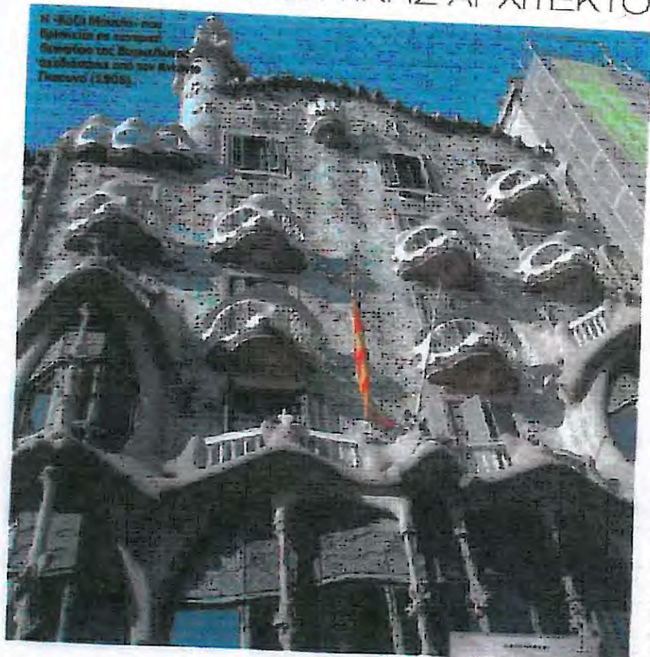
Η «Βασιλική» που εφευρέθηκε ως κλασική αναπόδειξη της Βυζαντινής αρχιτεκτονικής από τον Αντώνιο Γκαουτί (1703).