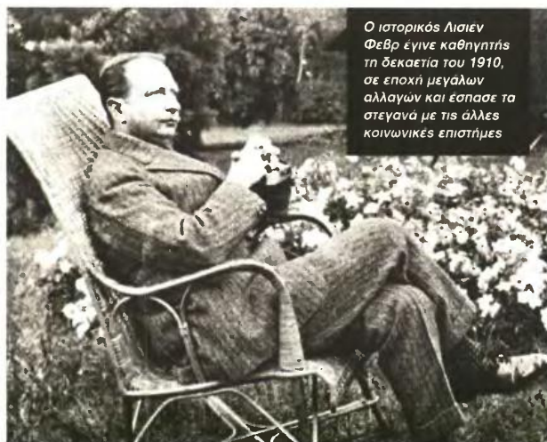
Ο ιστορικός Λισιέν Φεβρ έγινε καθηγητής τη δεκαετία του 1910, σε εποχή μεγάλων αλλαγών και έσπασε τα στεγανά με τις άλλες κοινωνικές επιστήμες